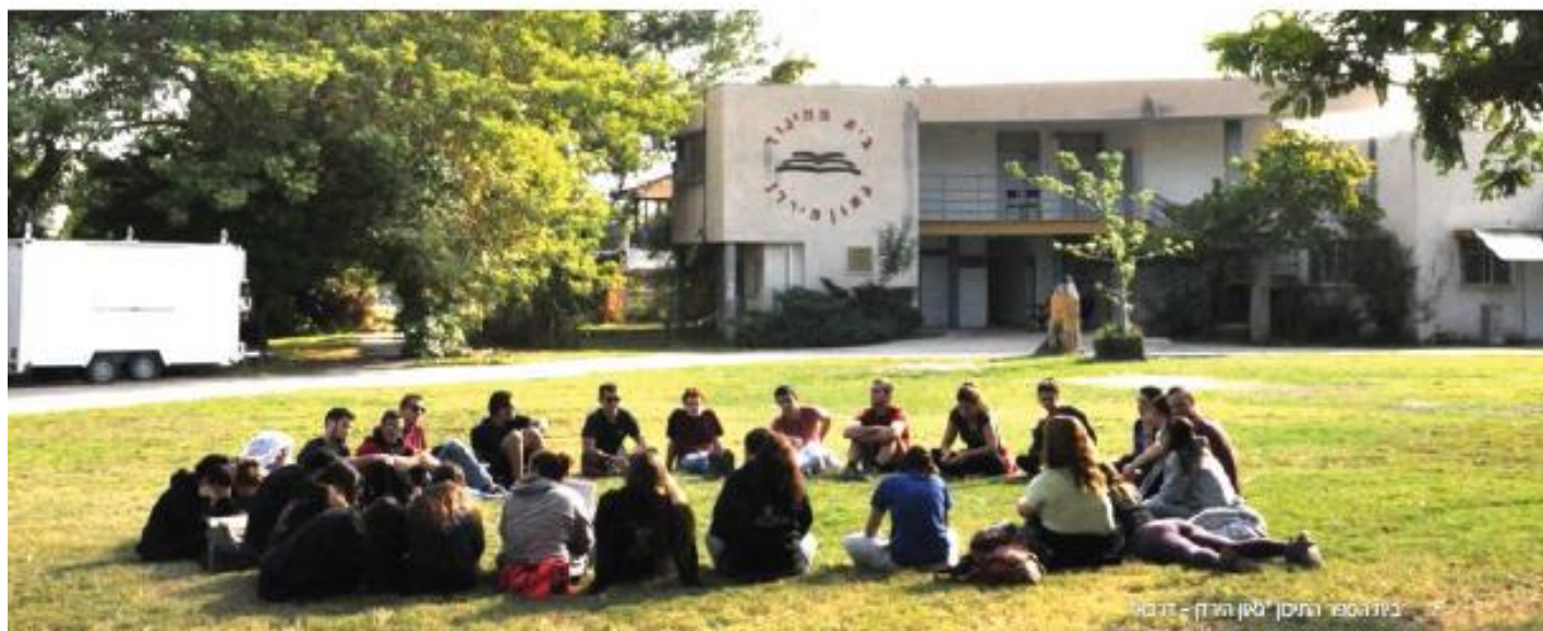
בית הספר התיכון גאון הירדן - דרבה

בחיי, בו יממש את שאיפתו "להשפיע במספרות". אני מרגיש שאני מגיע לתפקיד עם רקע, עם ניסיון במערכות גדולות, עם שלבים חשובים שעברתי בדרך ועם המון רצון להיטיב. הטיפ הכי חשוב בעיני הוא להגיע לא רק מוכן, אלא גם בלי אגו. זה לא תמיד קל, אבל אם מצליחים בכך, זה מאפשר פתיחות ושיתוף פעולה במערכת כולה".