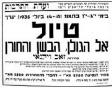
כרזה לביקור באזור שפורסמה לפני הכרזת המדינה