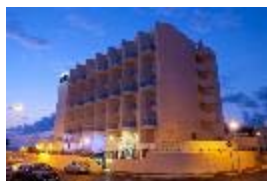
מלון מדיסון נהרייה

בימים א', ב' וג', תאריכים 08 עד 10 לאוגוסט 2021, נצא לטיול ונופשון בן שלושה ימים ושתי לילות על בסיס חצי פנסיון לאזור הצפון ונתארח במלון מדיסון על חוף ימה של העיר נהריה על בסיס חצי פנסיון. הטיול כולל את חיים המדריך ואוטובוס תיירים צמוד, להלן תוכנית ולו"ז הטיול: