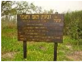
גבעת תום ותומר