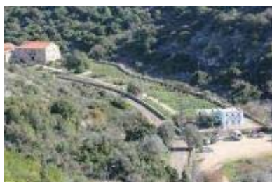
בוסתן תום בכרם מהר"ל