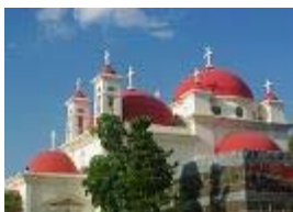
כנסיית 12 השליחים