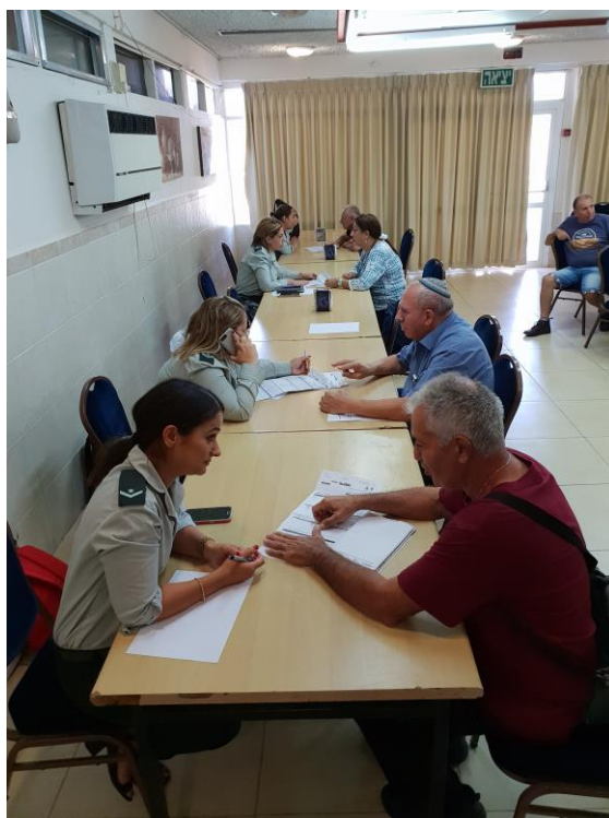
יום מופ"ת בסניף אילת